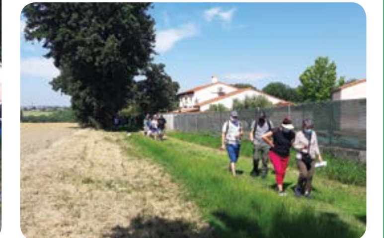
Quartier du Bézinat, entre ville et campagne