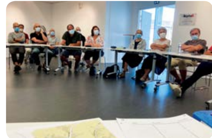
Habitants et référents de quartier en réunion avec le bureau d'études ID Cité

Le premier rendez-vous de l'Atelier Mobilité a eu lieu le 30 juin dernier. Il a confirmé des attentes fortes pour disposer d'aménagements sécurisant les déplacements et améliorant les liaisons piétonnes et cyclables entre les différents quartiers et le centre bourg.