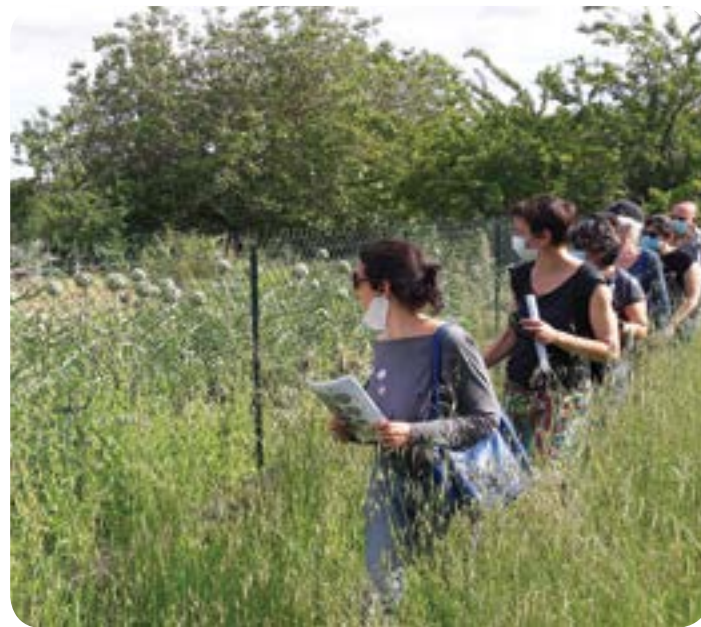
Chemin piéton entre Pissebaque et le Moulin Blanc