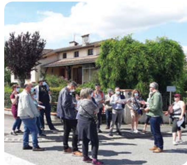
Arrêt Route de Lapeyrouse pour parler du développement du centre-bourg

Pourquoi ? Pour encourager et faciliter les mobilités douces, à pied et en vélo, pour éviter de consommer des terres agricoles et des espaces naturels par de nouvelles constructions, pour rapprocher les habitants des équipements et des services de la commune et construire un centre-bourg vivant et dynamique. Le PLU désigne ainsi une « aire de proximité », pour accueillir les nouveaux habitants et organiser la vie de tous. Les futures constructions se réaliseront donc dans ce périmètre, avec des types de densité variés selon les secteurs, de 4 à 30 logements à l'hectare.