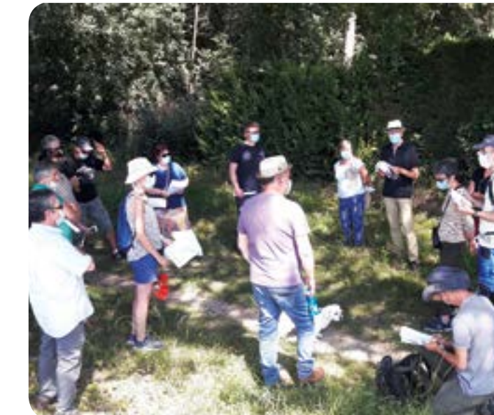
Echanges sur l'agriculture lors de la balade rurale du 12 juin 2021

Les espaces verts et les espaces bleus, c'est-à-dire les champs, les bois, les haies d'arbres, les coteaux, les zones inondables, les rivières ou les cours d'eau, font le paysage de Castelmaurou. Le PLU les répertorie et propose pour chacun une façon de les valoriser ou de les protéger.