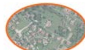
Maisons individuelles sous forme d'urbanisation diffuse densité d'environ 8 log / hectare (Chemin du Moulin Blanc)