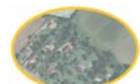
Maisons individuelles sous forme d'urbanisation peu dense densité d'environ 4 log / hectare (Chemin Rouquet)