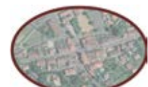
Tissu mixte du centre ancien densité d'environ 30 logements à l'hectare (Route d'Albi)